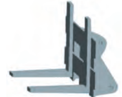
Garfo de carregamento de engate rápido