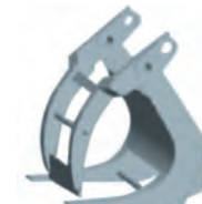
Garfo hidráulico de tora