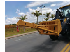
Braço de movimentação de materiais de engate rápido.