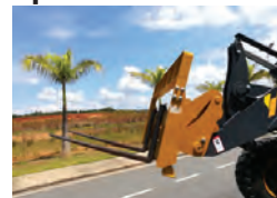
Garfo de carregamento de engate rápido.