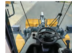
Cabine com ar-condicionado, ar quente e incêndio e para-sol inclusos.