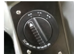
Seletor de faixas de trabalho com 3 modos de operação (econômico, normal e força total). Com economia de até 15% de combustível.