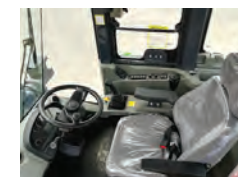
Coluna de direção com ajuste de altura e rebatimento. Assento ajustável com frio, ROPS/FOPS; Ótima visão para amortecimento bidirecional, apoio de braço e trabalho. Porta copo, extintor de suspensão.